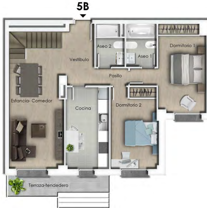
Planta 5 - vivienda 5B

44 viviendas con trastero y 66 garajes Calle Pedro de la Rúa 21 | Sector P1 Soria