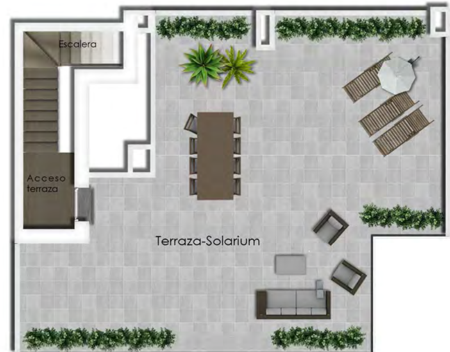
Planta bajocubierta - terraza de vivienda 5B

Plano comercial de vivienda | PORTAL 1 - VIVIENDA 5B | 190.000 € (I.V.A. no incluido)