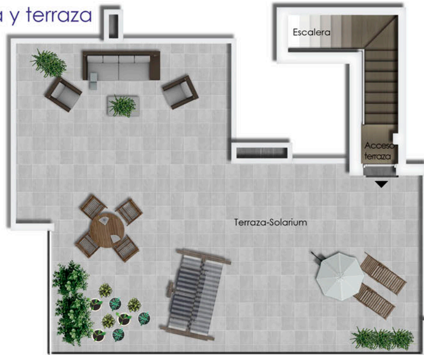
Planta bajocubierta | Terraza de vivienda 5°D